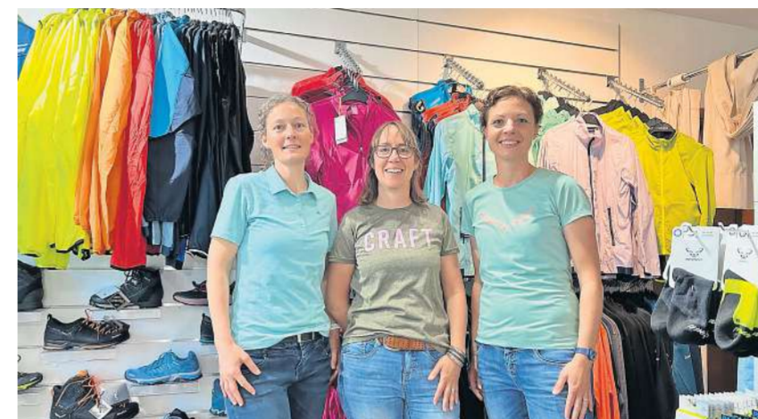
Das Team von Sport-B berät sie gerne.

Sport- und Freizeitmode für Jung und Alt, für Gross und Klein. Wenn man auf der Hauptstrasse durch Bütschwil fährt, erkennt man nicht auf den ersten Blick, welche grosse Auswahl Sport-B zu bieten hat. Ein Halt lohnt sich aber auf jeden Fall.