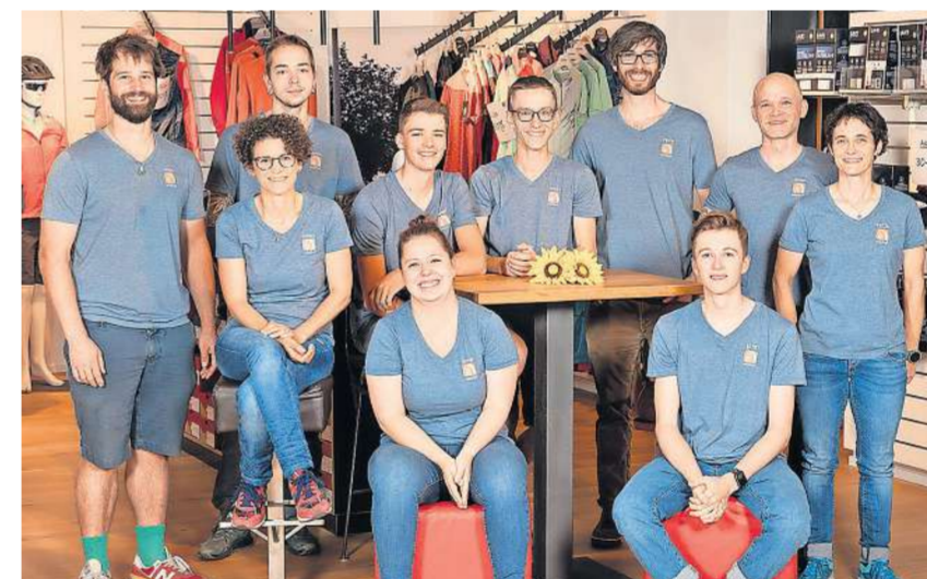
Das Expertenteam der Velotheke Bütschwil.

Die Experten der Velotheke Bütschwil sind Ihre Ansprechpartner bei allen Fragen rund ums Fahrrad. Eine kompetente Beratung ist dem Team ein hohes Anliegen.